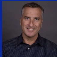
שי הלפרין הממונה על השינוע הביטחוני הבינלאומי משרד הביטחון