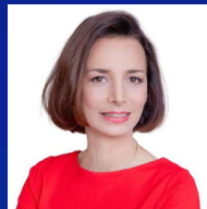
ד"ר ענת הוכברג מרום יועצת גיאופוליטית ומומחית לסיכונים גיאואסטרטגיים