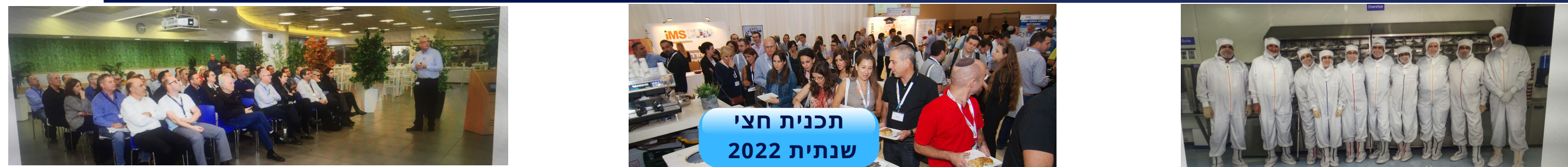
תכנית חצי שנתית 2022

הפורום הישראלי לתפעול ולניהול שרשרת אספקה מונה כיום למעלה מ-1,000 חברים המחדשים את חברותם כמדי שנה, אנו בשנה ה-23 לפורום, אתם השותפים להצלחתו של הפורום מיום היווסדו (1999) וממשיכים ללוות אותנו במגרש המקצועי המשמש את כל המנכ"לים, סמנכ"לי, מנהלי התפעול, ייצור, בכירי רכש, לוגיסטיקה, שרשרת האספקה, CTO, ניהול מפעלים ומובילי Industry 4.0, במגוון ההתמחויות בענפי המשק הישראלי בכל הפורומים המקצועיים והמגוונים