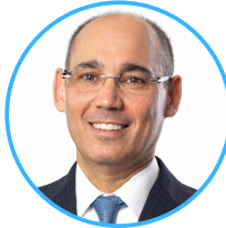
פרופ' אמיר ירון, נגיד בנק ישראל