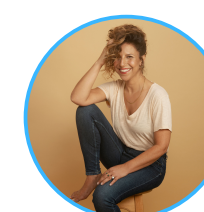
קרדיט, שי פרנקו הדר לוי, סטנד אפ

הוועידה המובילה בישראל בתחום התפעול ושרשרת אספקה בה משתתפים מידי שנה למעלה מ- 900 בכירים ומובילי דעה במשק. השנה נעסוק בוועידה בהתמודדות של המשק עם השלכות המגפה והמשבר הכלכלי. האתגרים, התפיסות ונדבר על כלים פרקטים לניהול המציאות החדשה.