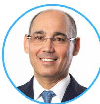
פרופ' אמיר ירון, נגיד בנק ישראל